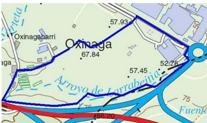
Imagen 3.- Senda Uxinas, marcada en azul

En estas dos páginas viene información diversa sobre los valores naturales del entorno de la senda, que es frecuentada por vecinos del Txorierrri, excursionistas, ciclistas y peregrinos del Camino de Santiago. Al ser bastante lisa y estar acondicionada para ello, es transitable en parte en silla de ruedas.