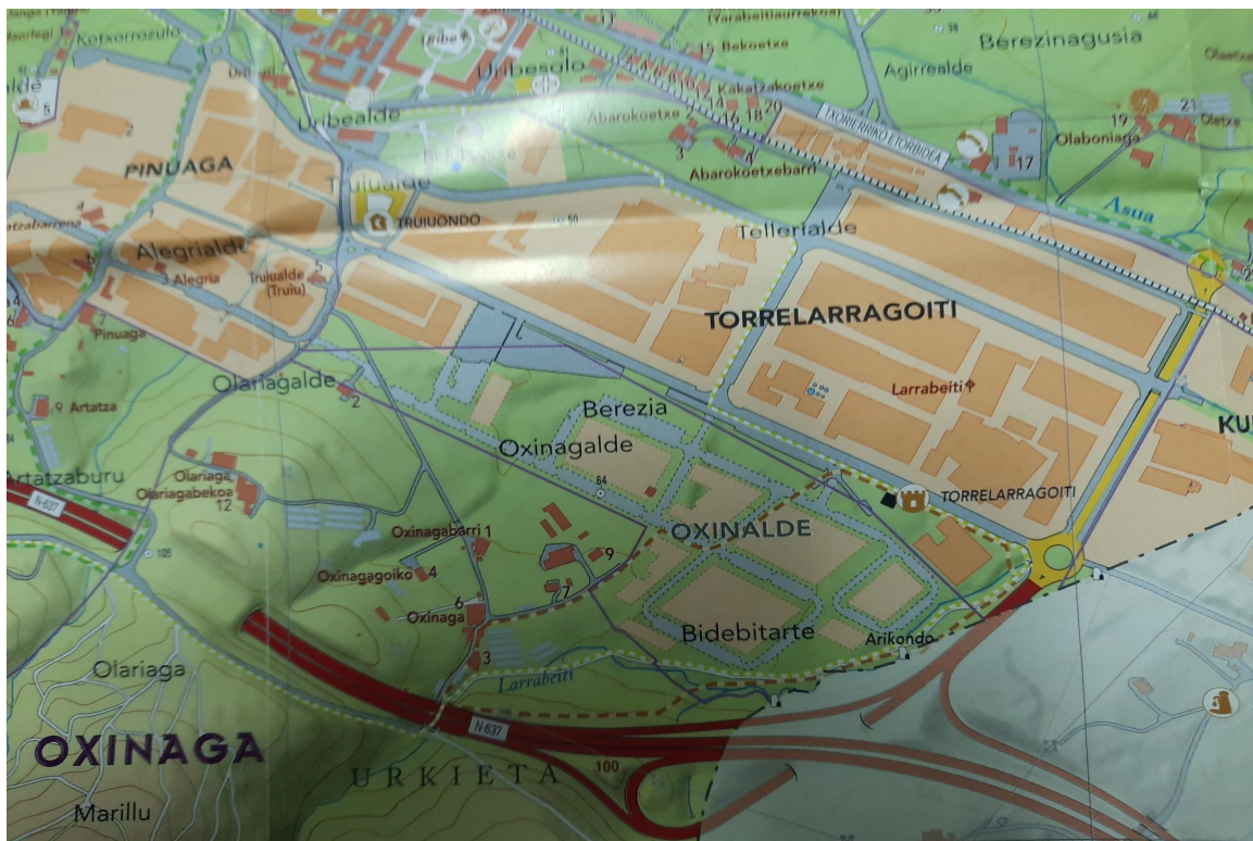
Imagen 2.- El SAPUT Uxinalde, Oxinalde en el mapa.

- El área mejor conservada de Uxinalde, el ámbito rural, sufre actualmente una nueva amenaza; puede sufrir una drástica transformación, ya que se encuentra parcialmente catalogada como zona urbanizable, en lo que se conoce como SAPUT UXINALDE, ubicado en su totalidad en Zamudio.